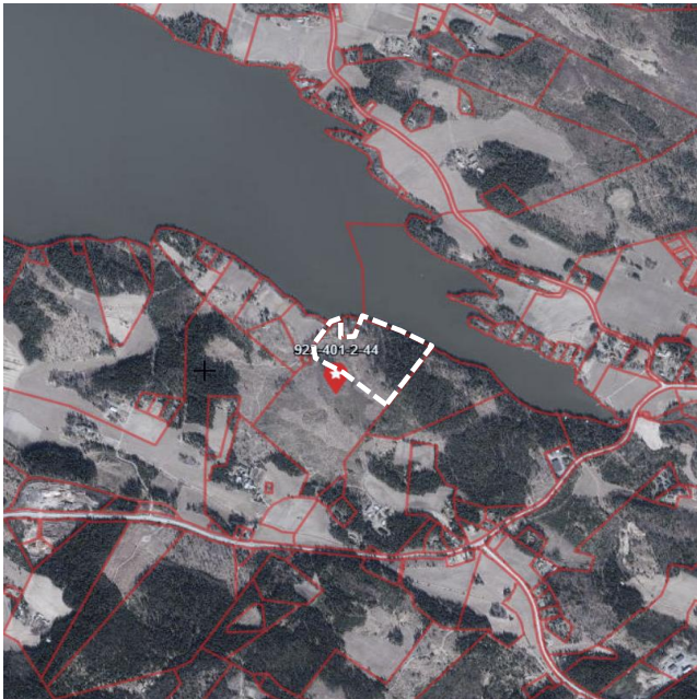
Kuva 1 Ilmakuva (maanmittauslaitos). Suunnittelualan likimääräinen raja-alue valkoisella katkoviivalla.

401 (Keihonen) Nälkäniementie, 37470, Vesilahti