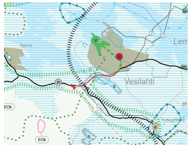
Kuva 2. Ote Pirkanmaan maakuntakaavasta 2040.